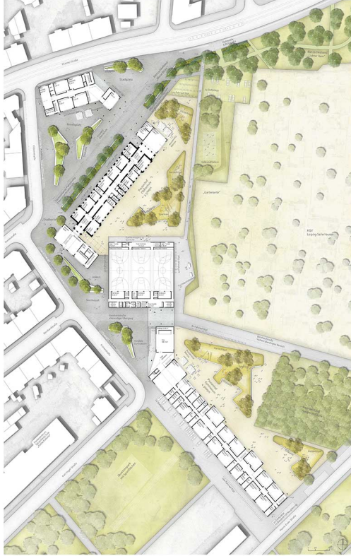
Gundris & Obergriesche 1.jpg